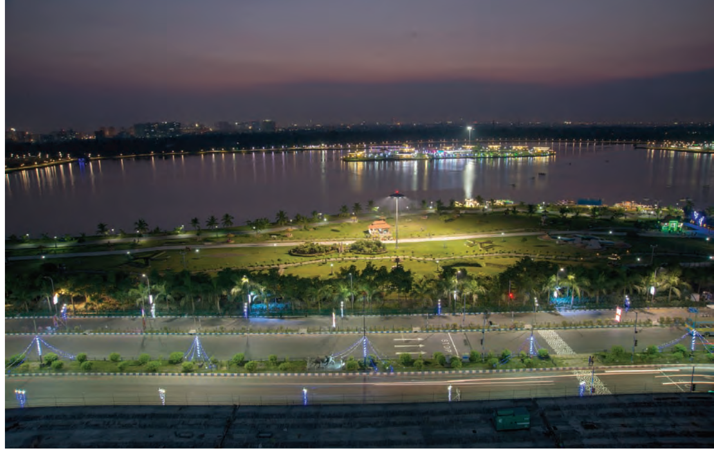
সন্ধ্যার আলোয় মায়াবী ইকোপার্ক।