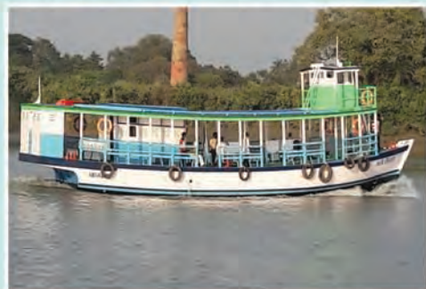
M.V. ROUDRACHHAYA (Placed at Haldia jetty Ghat)