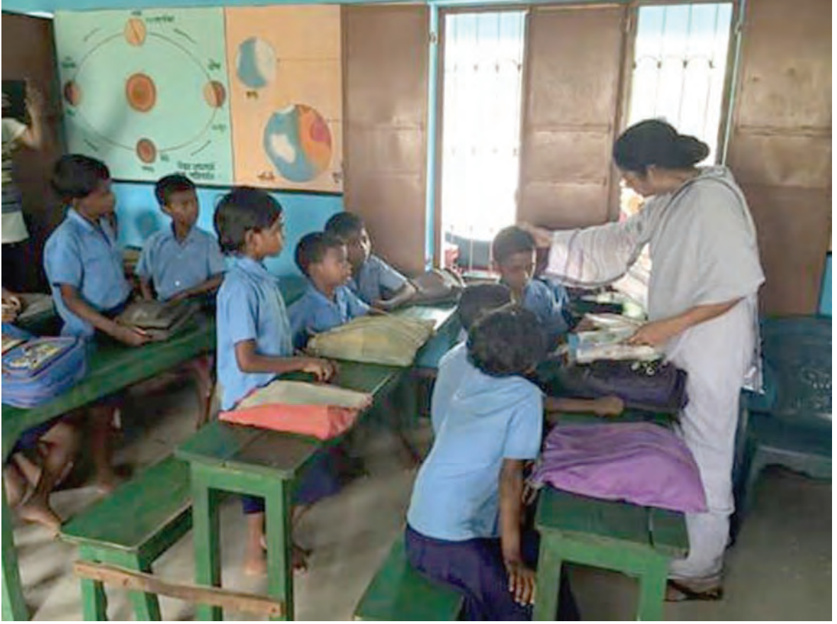
মুখ্যমন্ত্রী যখন শিক্ষয়িত্রীর আসনে

ছাত্রছাত্রীর মনের স্বাধীনতাকে ব্যাহত না করে—বরং তাদের ভাবনাচিন্তার ধারাকে উন্মুক্ত ও প্রসারিত করতে পারে। নানা বিষয়ের পাঠ যেন তাদের ভাবায়—আলোড়িত করে। কারণ এভাবেই তৈরি হবে একটি শিশুর মনের নিজস্ব অভিব্যক্তি।