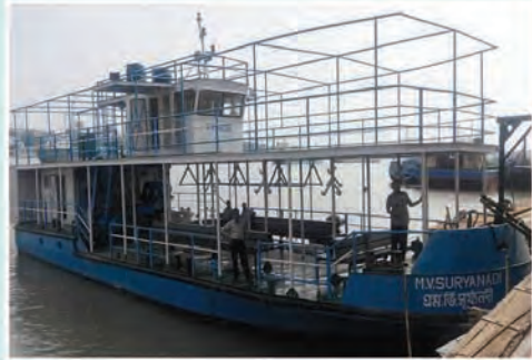
M.V. SURYANADI (Plying between Monirampur and Sheoraphully)