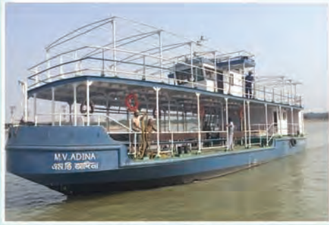
M.V. ADINA (Plying between Konnagar and Panihati)