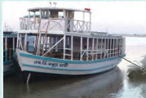
M.V. SABUJ SATHI (Placed at Gosaba ghat)