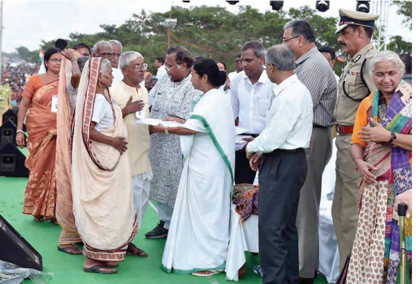
সিঙ্গুর-জয়ী সরকারের কথা-রাখার উৎসবের একটি মুহূর্ত