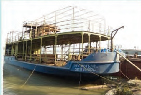
M.V. MOTIJHIL (Plying between Belur and Kuthighat)