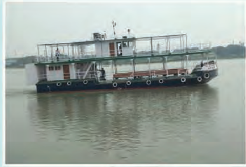
M.V. MEGHBRISTI (Plying between Cossipur and Belur)