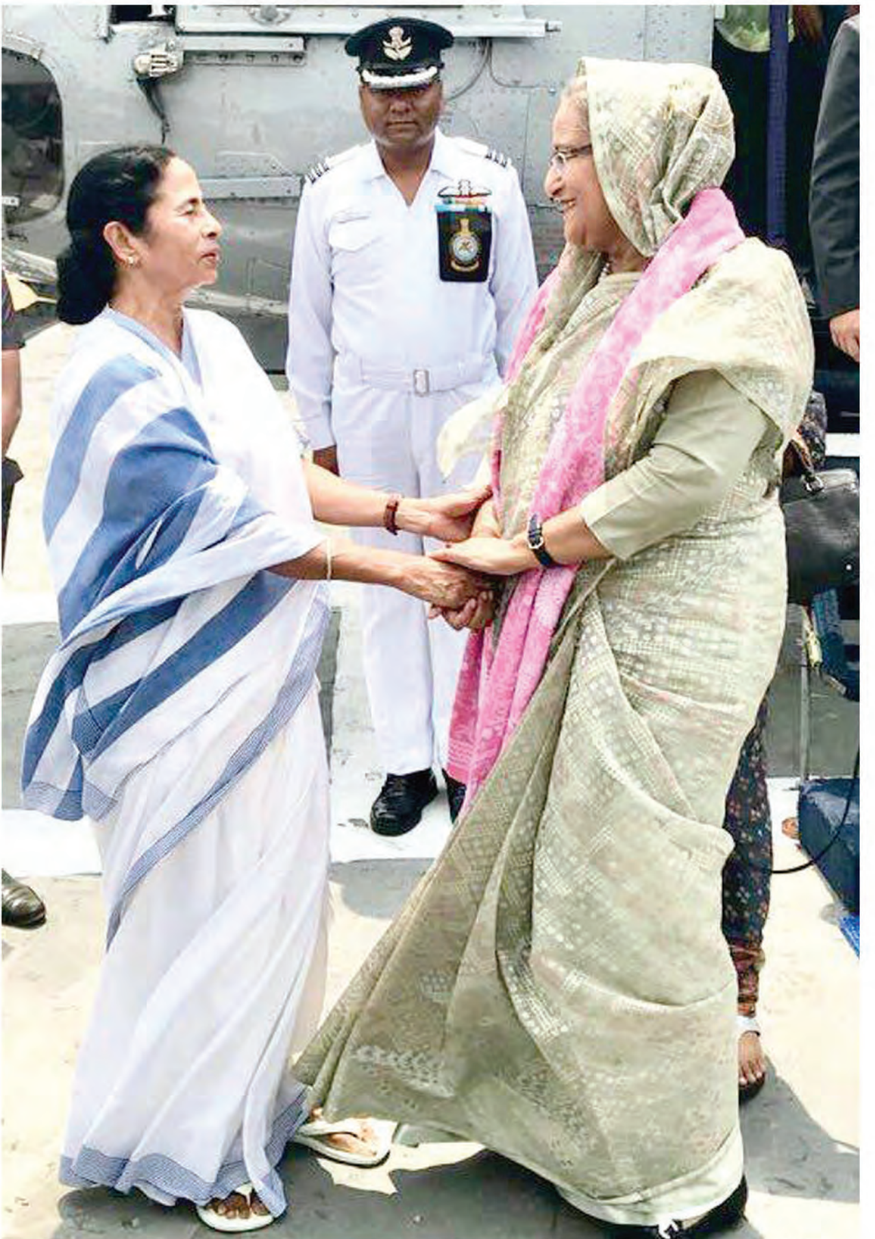
২৫ মে, ২০১৮। বাংলাদেশের প্রধানমন্ত্রী শেখ হাসিনাকে স্বাগত জানাচ্ছেন রাজ্যের মুখ্যমন্ত্রী মমতা বন্দ্যোপাধ্যায়। বিশ্বভারতী বিশ্ববিদ্যালয়ে 'বাংলাদেশ ভবন' উদ্বোধন ও কাজী নজরুল ইসলাম বিশ্ববিদ্যালয়ের সাম্মানিক ডিগ্রি গ্রহণ উপলক্ষে শেখ হাসিনার এই রাজ্যে আসা।