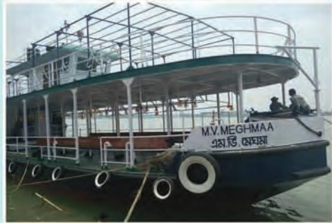
M.V. MEGHMAA (Plying between Cossipur and Howrah)