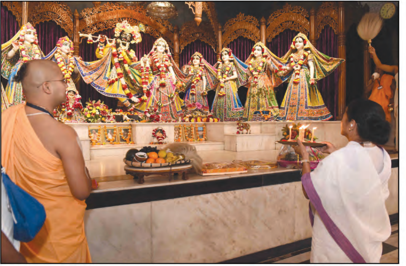
১২ ফেব্রুয়ারি, ২০১৮। নদিয়ার মায়াপুরে ইসকনের মন্দিরে মুখ্যমন্ত্রী (উপরে)। সেদিনই চাঁদ কাজির মাজার পরিদর্শনে যান মুখ্যমন্ত্রী (নীচে)।