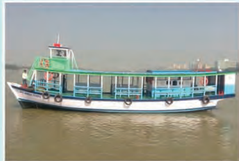
M.V. JUNGAL KANYA (Placed at Temp. ghat near Iswargupta Bridge)